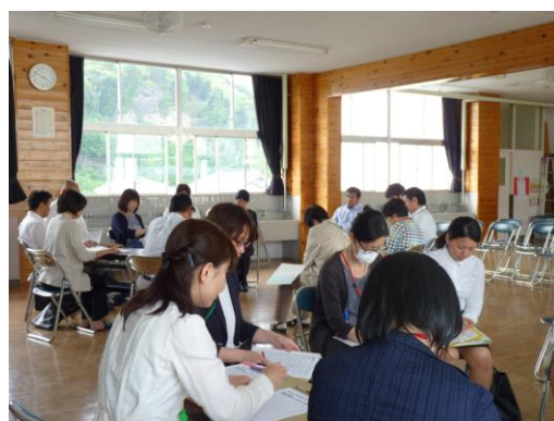
＜「校区一貫研」に臨む教職員＞

6月には、各園と学校間で互いに「保育・授業を見せ合う会」を計画し、訪問し合います。