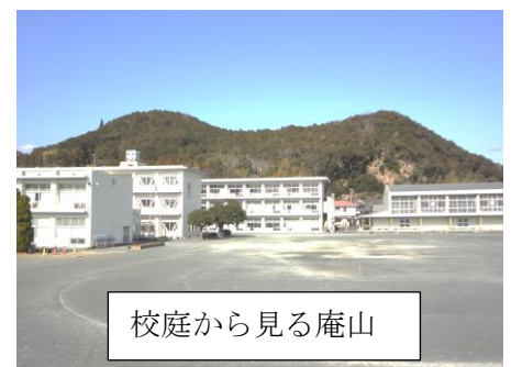
校庭から見る庵山

100年もの長い間、森小学校を巣立った多くの卒業生の心に息づき、小学校の思い出と共に歌われてきた由緒ある校歌です。