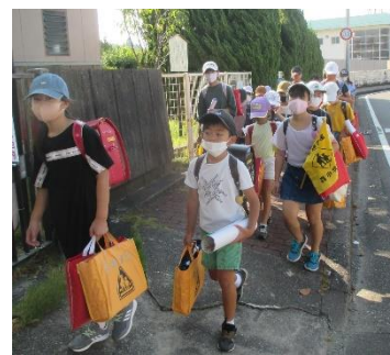
2学期初日登校風景

それでは、2学期85日間はすばらしい日々となることを期待して、私の話を終わります。