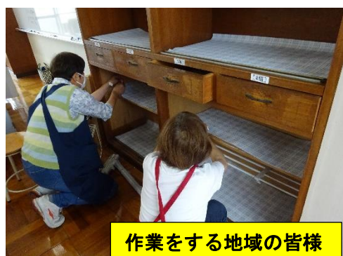
作業をする地域の皆様

の観光ボランティアの方々とのフィールドワーク。家庭科では、2年ぶりの調理実習再開のために、地域の方々の協力を得て、家庭科室、準備室、備品などの清掃及び整理整頓、コロナ対策として消毒活動など、学校職員の手の行き届かないところに力強い応援をいただきました。昨年度まで継続していただいている読み聞かせ