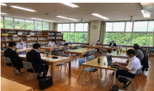
協議を行う学校運営協議会委員の皆様

社会状況の変化や多様化が進み、今や学校だけでは解決できない課題が山積しています。小中が連携し、保護者、地域の皆様のお力をいただきながら進めてまいります。これまでも地域学校連携活動推進委員の積極的な働き掛けにより、教育活動では、6年生歴史（三倉・天方・森地区）探検