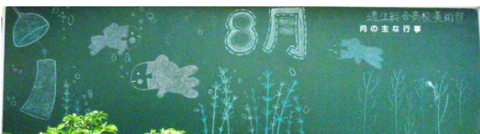
【正門前の8月黑板アート】 遠江総合高校美術部作成